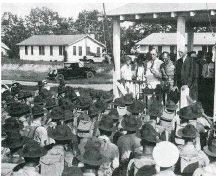
El general Smedley D. Butler se despide de «sus muchachos» en ocasión de su retiro, Base de la Infantería de Marina en Quantico, Virginia, 23 de septiembre de 1931.