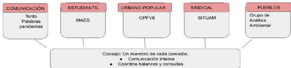
Figura 1. Estructura general de Tejiendo Organización Revolucionaria y sus frentes de trabajo.